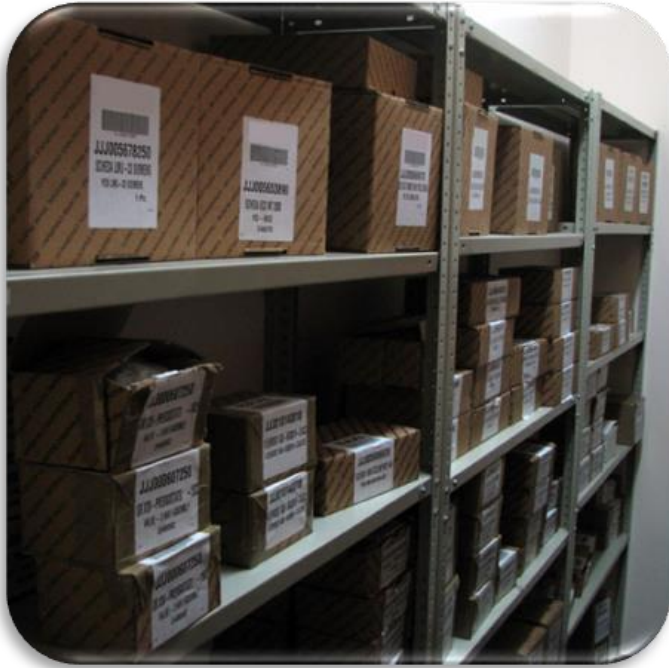
Склад хранения ЗЧ