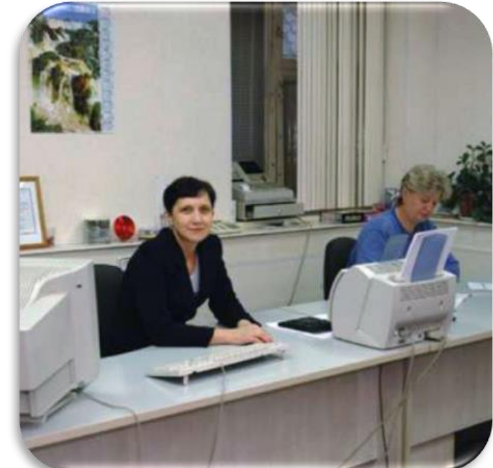
Оргтехника, телефон, интернет