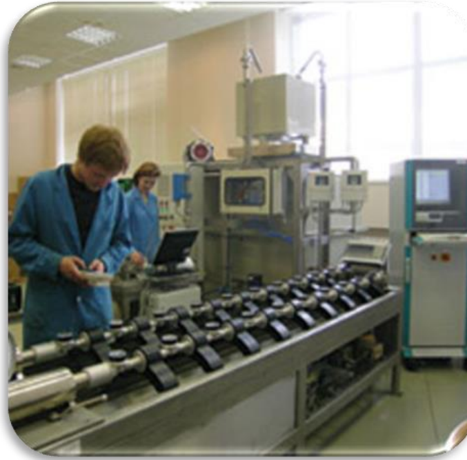
Средства диагностики, измерения и контроля